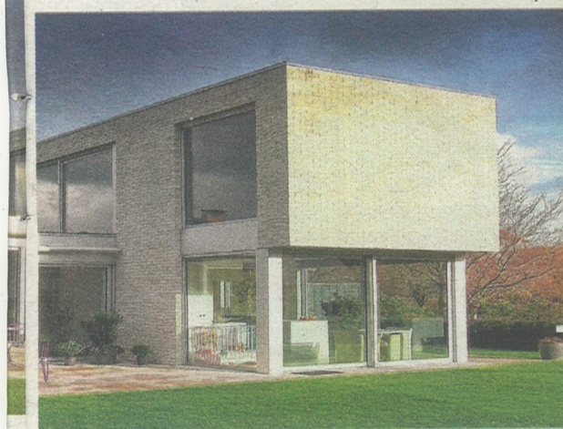
De bovenverdieping geeft uit op een groot dakterras.