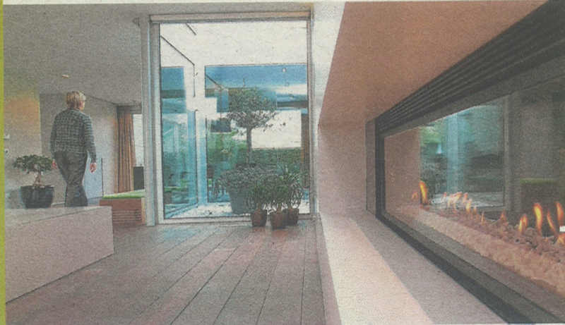
De zit- en eetruimte worden subtiel gescheiden door een kleine patio.