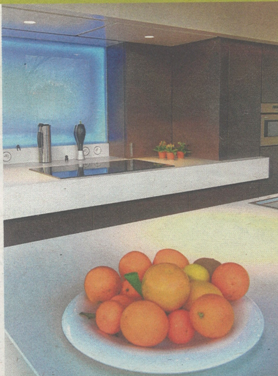
De keuken is strak en modern maar voelt door de donkerbruine kleur toch warm aan. Het kookgedeelte bevindt zich tegen de wand en de dampkap is discreet ingewerkt in een kast.