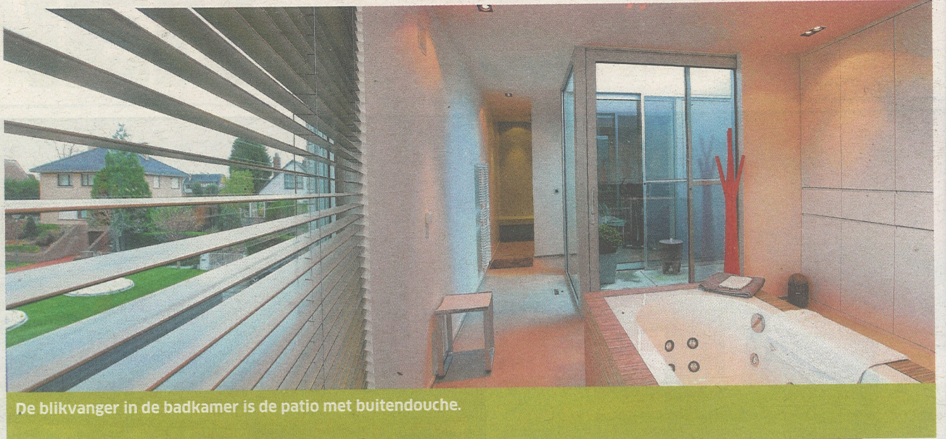
De blikvanger in de badkamer is de patio met buitendouche.