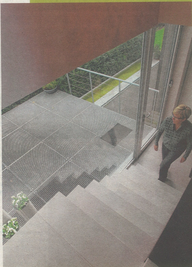
Een zwevende trap leidt naar de bovenverdieping, maar er is ook een lift.